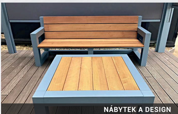
NÁBYTEK A DESIGN